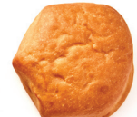
Exceso de levado